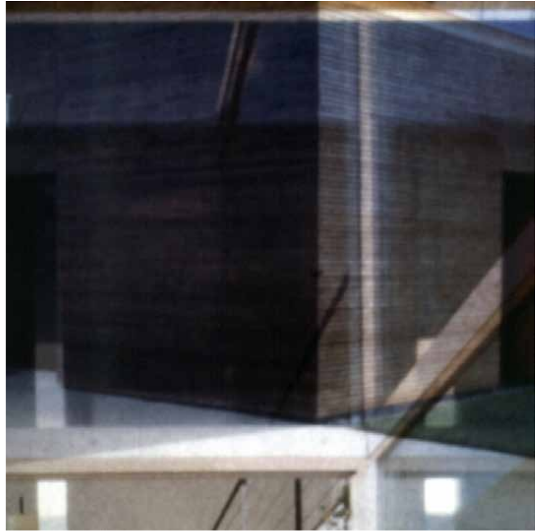
Gebaute Räume – elfi andereg