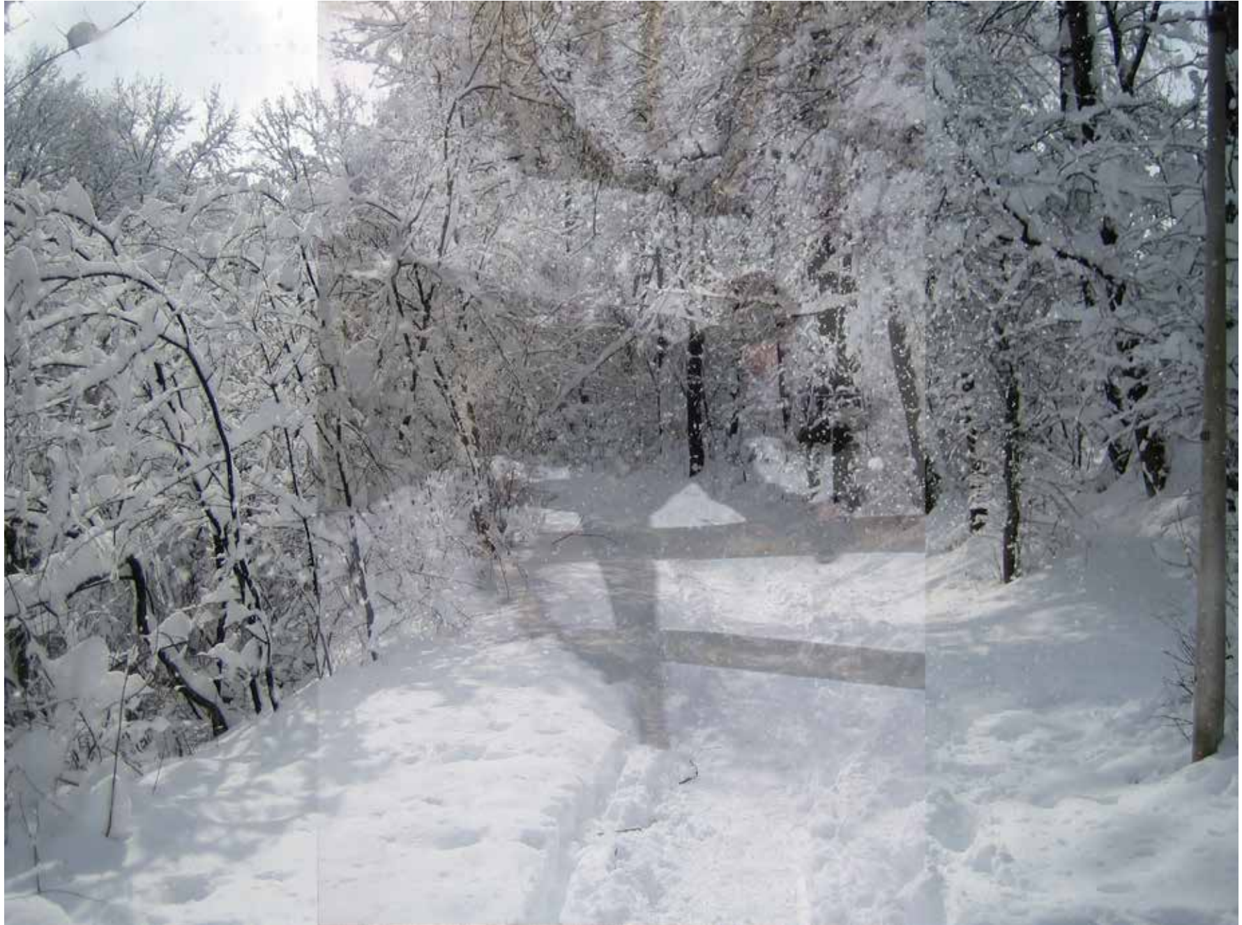
winter.wald – elfianderegg2020