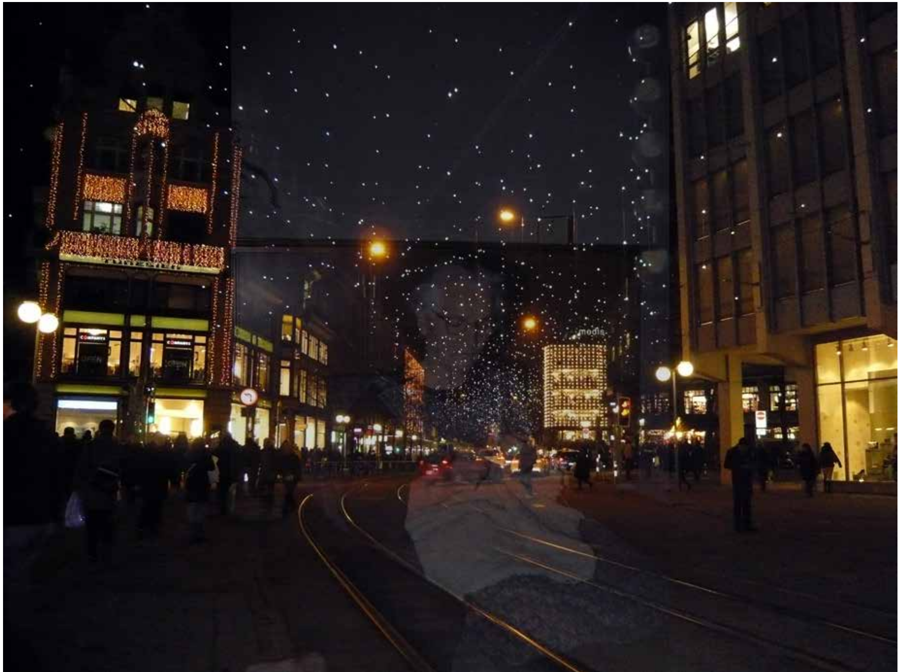
nacht.zauber – elfianderegg2020