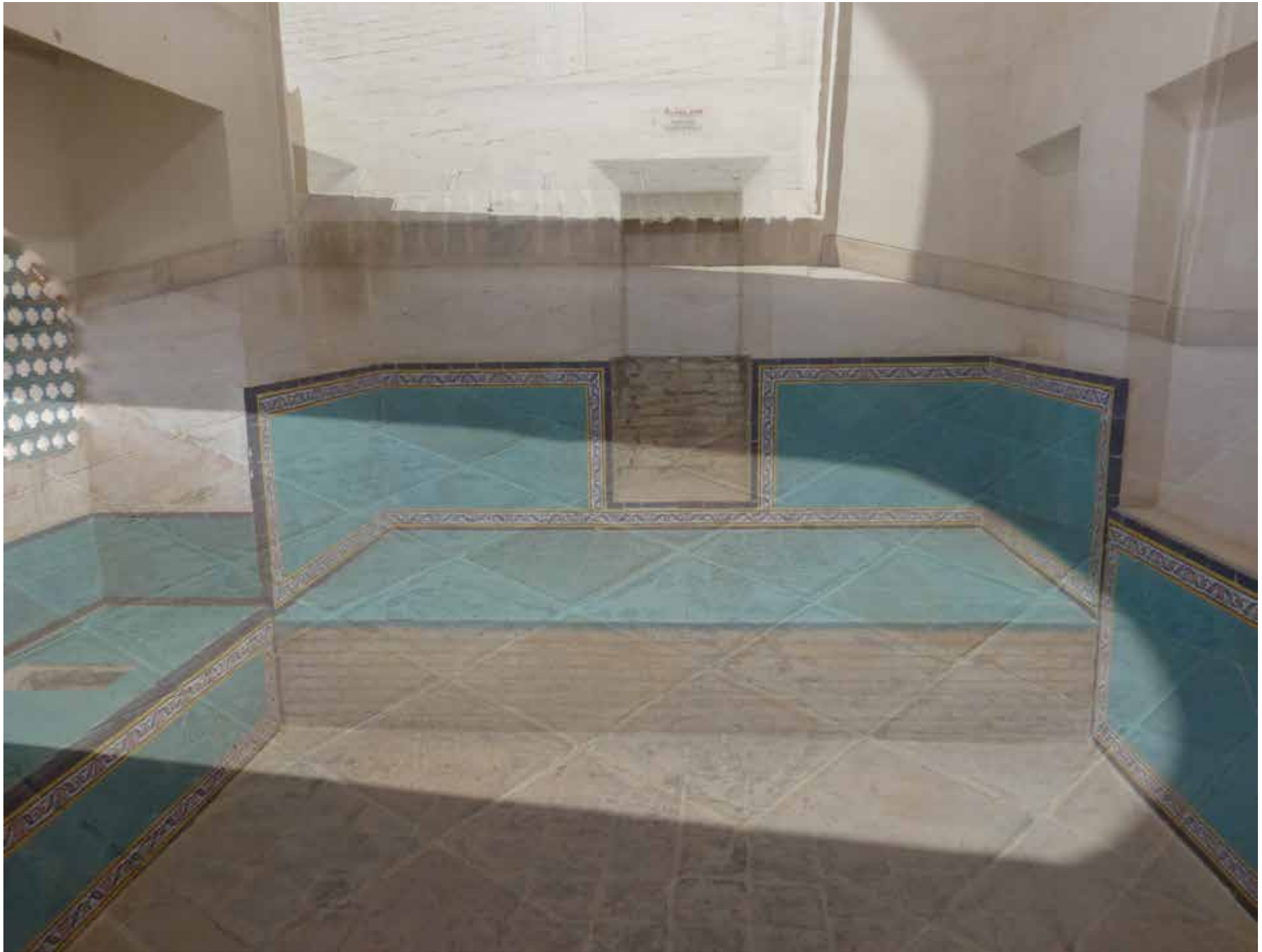
Persian Tales – Lights and Shadows – elfi anderegg