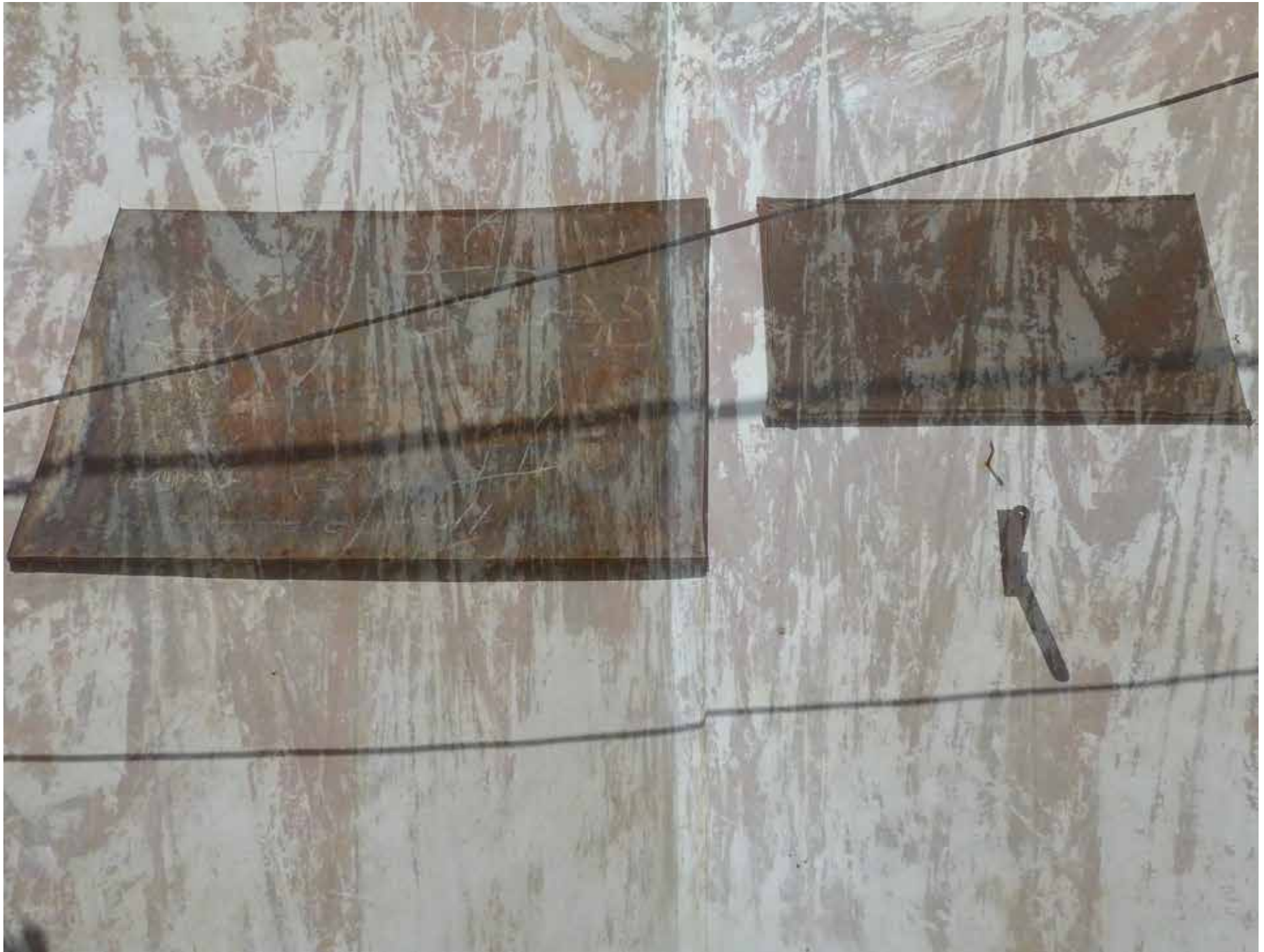
Persian Tales – Hidden Place – elfi anderegg