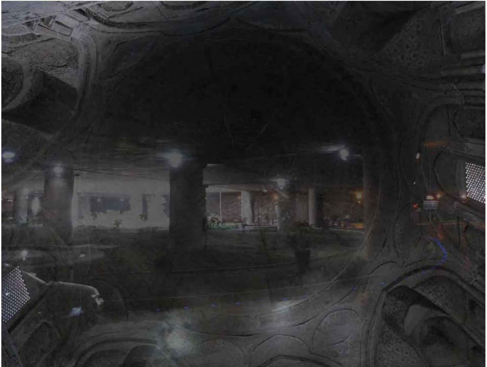
Persian Tales – Mysterious Roundabout – elfi anderegg